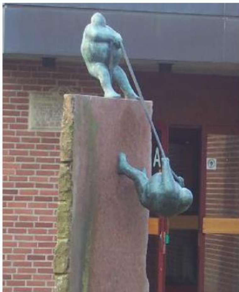
Værk: Keld Moseholm, 1995

Praktikniveau I Praktikniveau II Praktikniveau III