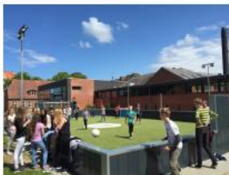
Multibanen, Ubberud Skole